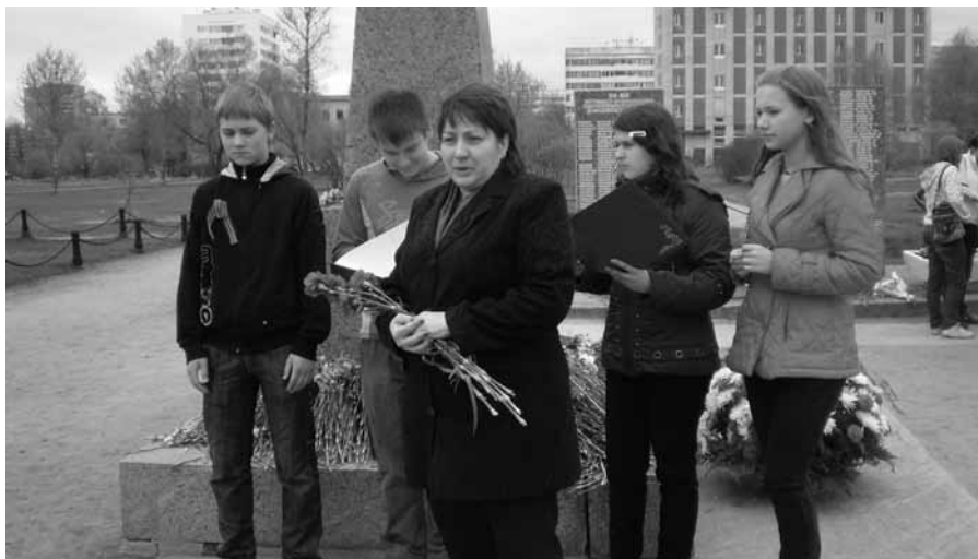
Детское общественное объединение «Десант памяти». Члены объединения составляют экспедиционный отряд