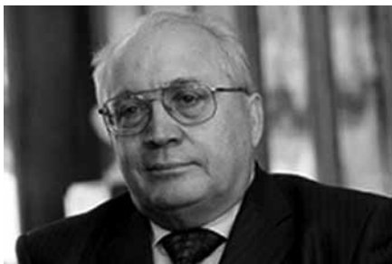
Садовничий Виктор Антонович

Так считает ректор МГУ Виктор Садовничий. «Уровень подготовки выпускников школ упал, по математике, химии физике, да и по гуманитарным наукам», – сказал Садовничий, выступая на круглом столе «Традиции и качество образования» в рамках конференции Общероссийского народного фронта, сообщает РИА «Новости».