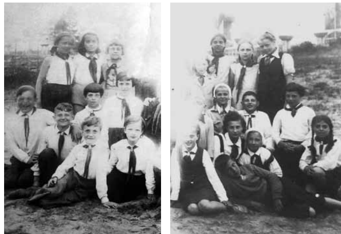
Архивные фотографии. 1941 год